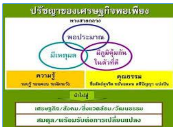
ภาพที่ 1.3 ปรัชญาของเศรษฐกิจพอเพียง

เศรษฐกิจพอเพียง (Sufficient Economy) หมายถึง ความพอประมาณ ความมีเหตุผล รวมถึงความจำเป็นที่จะต้องมีระบบภูมิคุ้มกันในตัวที่ดีพอสมควรต่อการมีผลกระทบใด ๆ อันเกิดจากการเปลี่ยนแปลงทั้งภายนอกและภายใน ทั้งนี้ เศรษฐกิจพอเพียงจะต้องอาศัยความรอบรู้ ความรอบคอบ และความระมัดระวังอย่างยิ่ง ในการนำวิชาการต่าง ๆ มาใช้ในการวางแผน และดำเนินการทุกขั้นตอน ในขณะที่เดียวกันต้องเสริมสร้างพื้นฐานจิตใจของคนในชาติ ให้มีสำนึกในคุณธรรมความซื่อสัตย์สุจริต และให้มีความรอบรู้ที่เหมาะสม ดำเนินชีวิตด้วยความอดทน มีความเพียร มีสติปัญญา และรอบคอบ เพื่อให้สมดุลและพร้อมต่อการรองรับการเปลี่ยนแปลงอย่างรวดเร็ว และกว้างขวาง ทั้งด้านวัตถุ สังคม สิ่งแวดล้อม และวัฒนธรรมจากโลกภายนอกได้เป็นอย่างดี