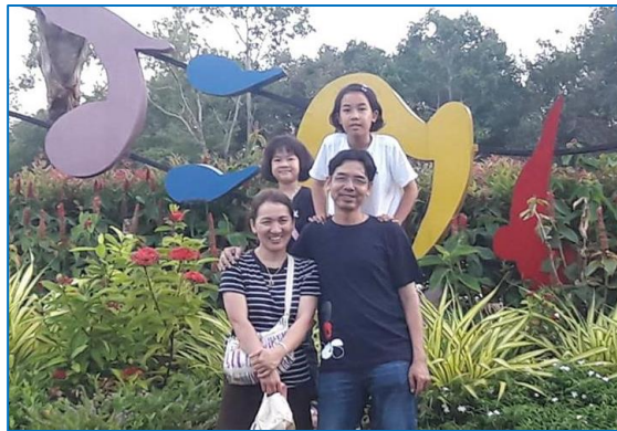
ภาพที่ 1.1 ครอบครัวเดี่ยว ประกอบด้วย พ่อ แม่ และลูก

3.3.2 ครอบครัวขยาย (Extended families) ประกอบด้วย บิดามารดา เครือญาติ รวมถึงบุคคลอื่นที่มาสมทบในภายหลัง บุคคลที่ไม่ใช่เครือญาติแต่มาอยู่ร่วมชายคาเดียวกันเสมือนเครือญาติก็ได้ เช่นลูกแต่งงานแล้วก็ยังอาศัยอยู่ในครอบครัวเดิม บางครั้งเรียกครอบครัวประเภทนี้ว่า “ครอบครัวร่วม” หรือ Joint family ตัวอย่างภาพครอบครัวขยาย ดังภาพที่ 1.2