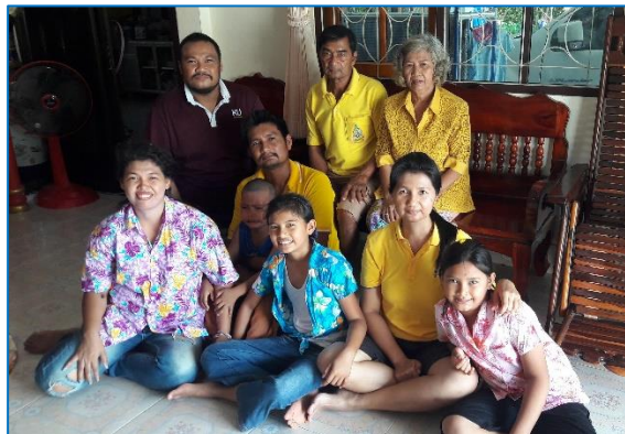
ภาพที่ 1.2 ครอบครัวขยาย ประกอบด้วย พ่อ แม่ ลูก และเครือญาติ

3.3.2 ครอบครัวขยาย (Extended families) ประกอบด้วย บิดามารดา เครือญาติ รวมถึงบุคคลอื่นที่มาสมทบในภายหลัง บุคคลที่ไม่ใช่เครือญาติแต่มาอยู่ร่วมชายคาเดียวกันเสมือนเครือญาติก็ได้ เช่นลูกแต่งงานแล้วก็ยังอาศัยอยู่ในครอบครัวเดิม บางครั้งเรียกครอบครัวประเภทนี้ว่า “ครอบครัวร่วม” หรือ Joint family ตัวอย่างภาพครอบครัวขยาย ดังภาพที่ 1.2